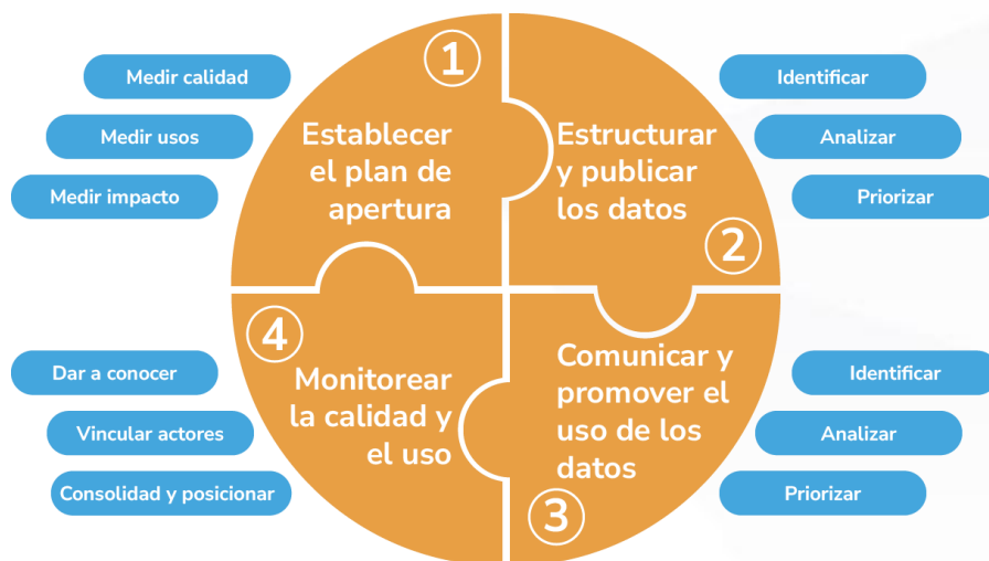
Ilustración 2 Ciclo de Vida de los Datos

Estas fases permiten consolidar un proceso continuo de apertura y mejora, articulando la estrategia institucional con las necesidades del ecosistema de datos abiertos.