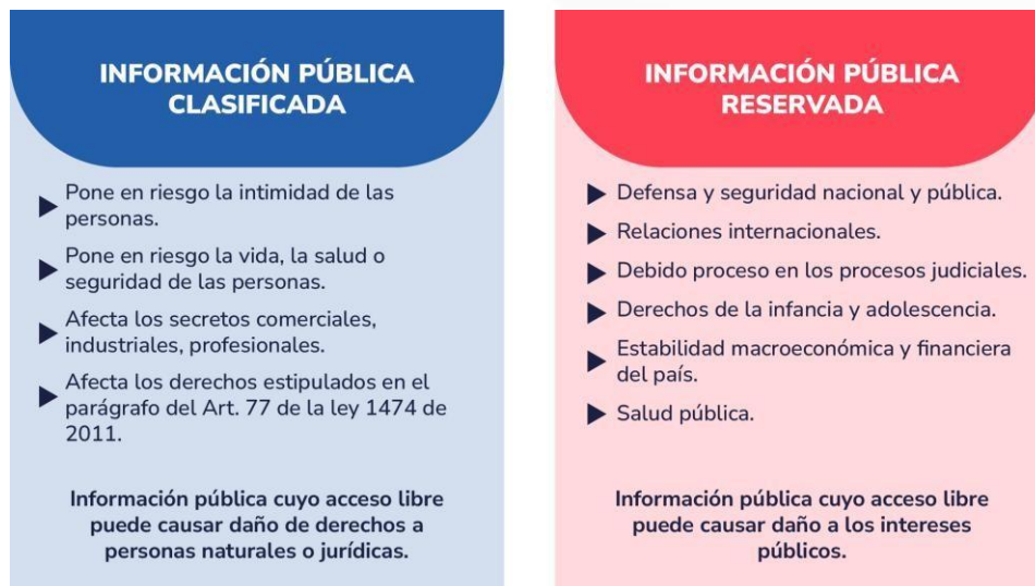
Ilustración 4 INFORMACIÓN CLASIFICADA Y RESERVADA