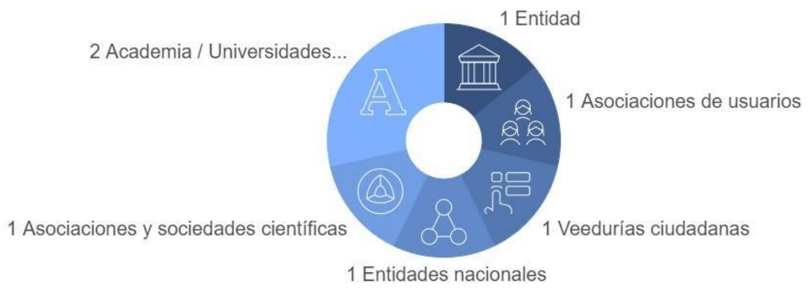
Ilustración 3 ECOSISTEMA DE INTERACCIÓN

Este ecosistema fortalece la colaboración interinstitucional, la transparencia y la generación de valor público mediante el uso responsable y ético de los datos abiertos.